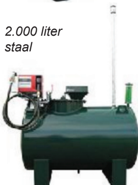
2.000 liter staal