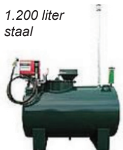
1.200 liter staal