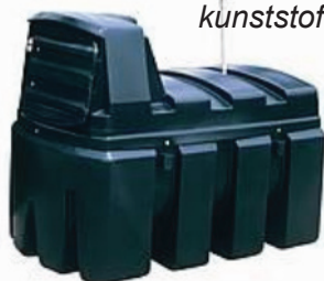
2.500 liter kunststof