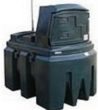
1.300 liter kunststof