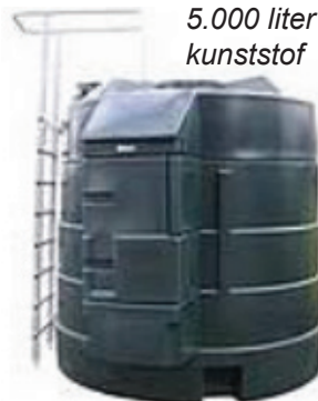
5.000 liter kunststof